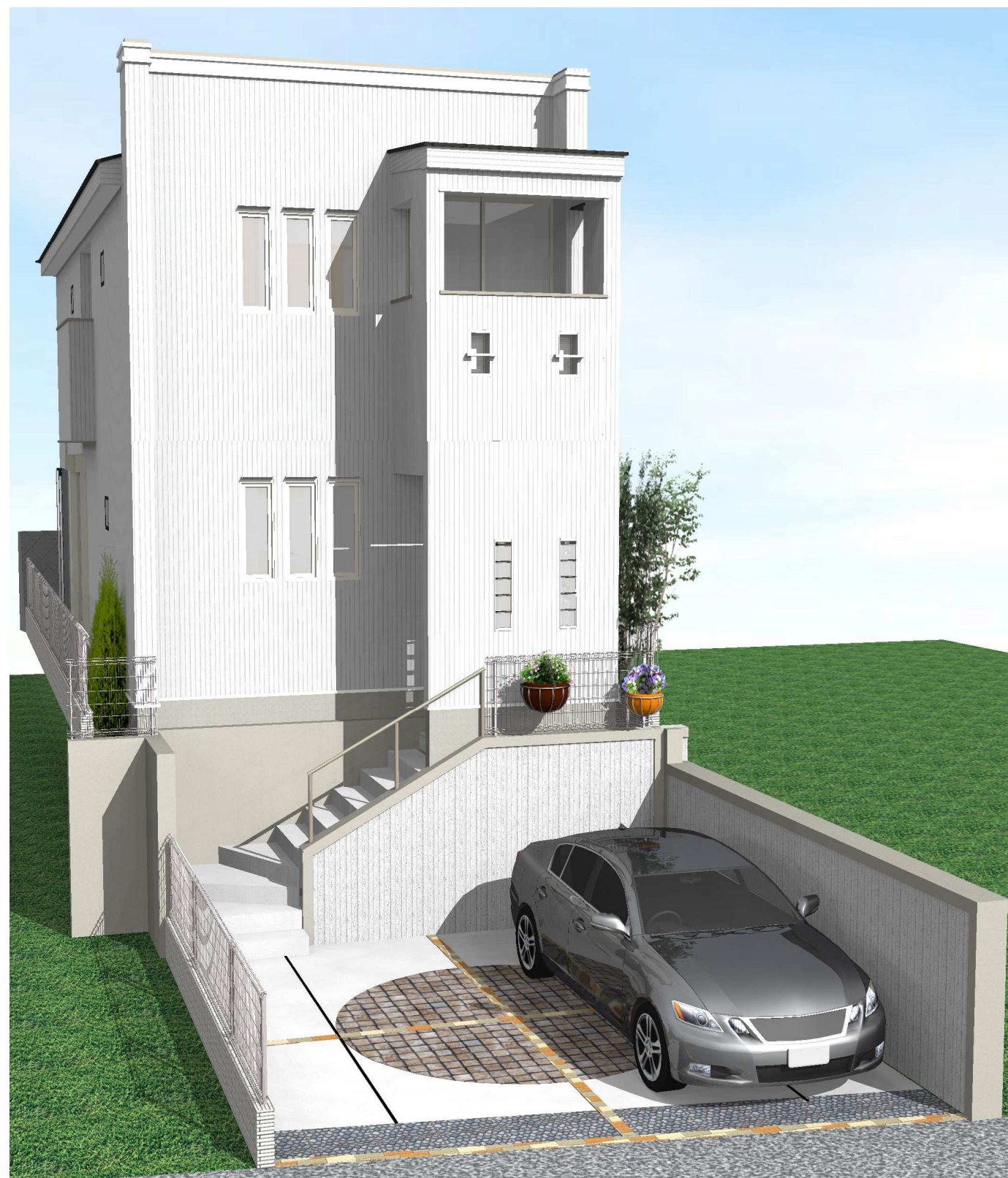
〈弊社推奨プラン(例)〉 ※パースは一例です。イメージの為、実際とは多少異なります。建物は現地に建っておりません。